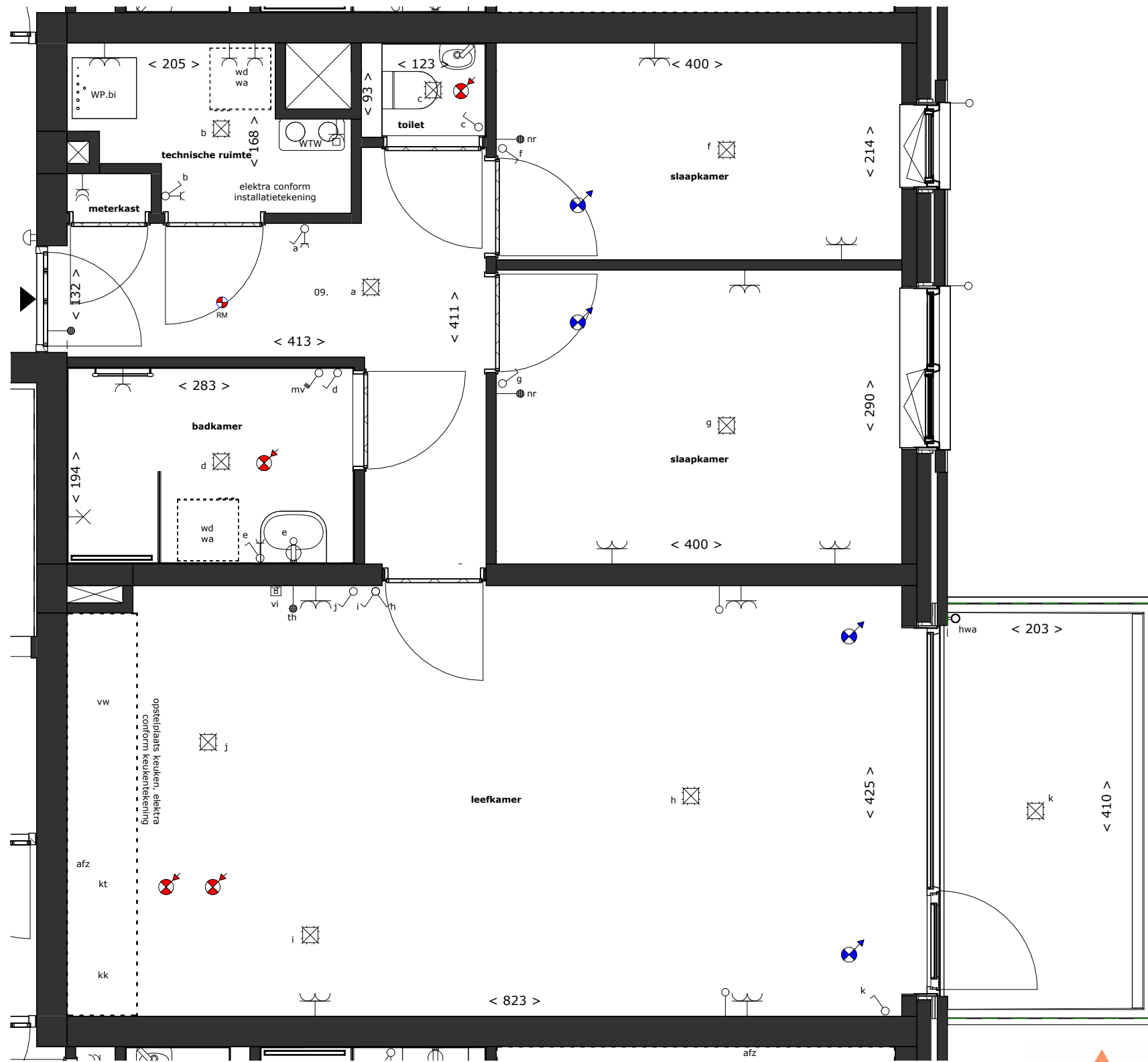
v.01. eerste verdieping - bouwnummer 9 1 : 50