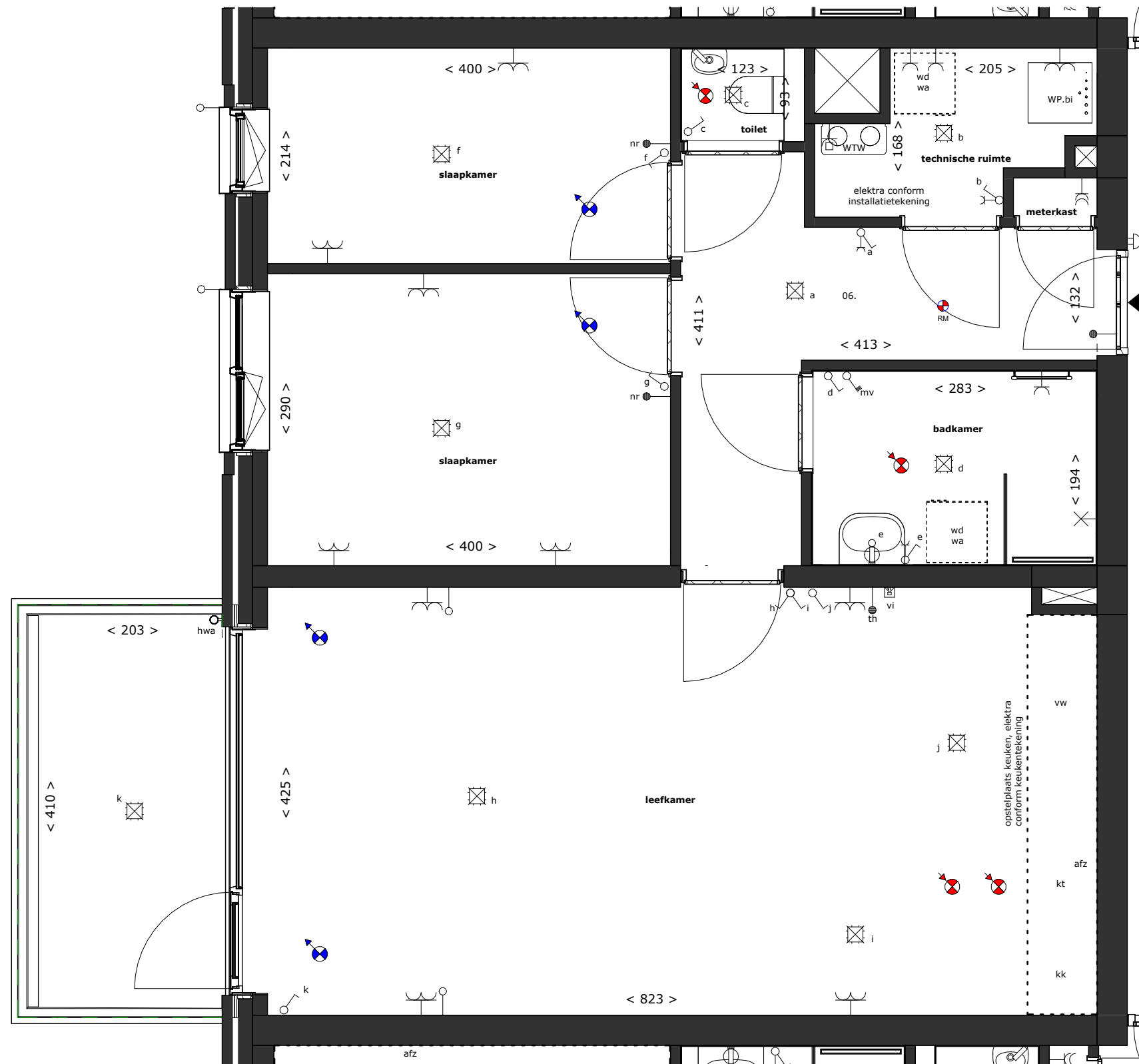
v.01. eerste verdieping - bouwnummer 6 1 : 50